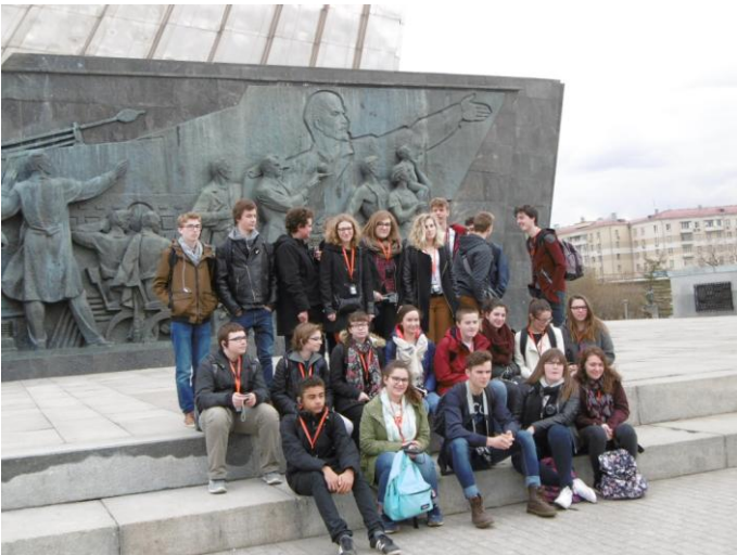
Au musée des cosmonautes (monument extérieur).

Nous déjeunons en centre ville toujours dans un décor pittoresque.