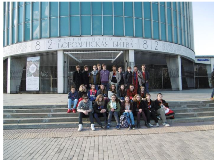
Devant le musée panorama de Borodino.

L'après midi nous nous rendons au musée panorama de la Bataille de Borodino. Même si nous n'avons pas sur tous les points la même analyse des événements et de leurs conséquences, nous avons trouvé la présentation très intéressante!