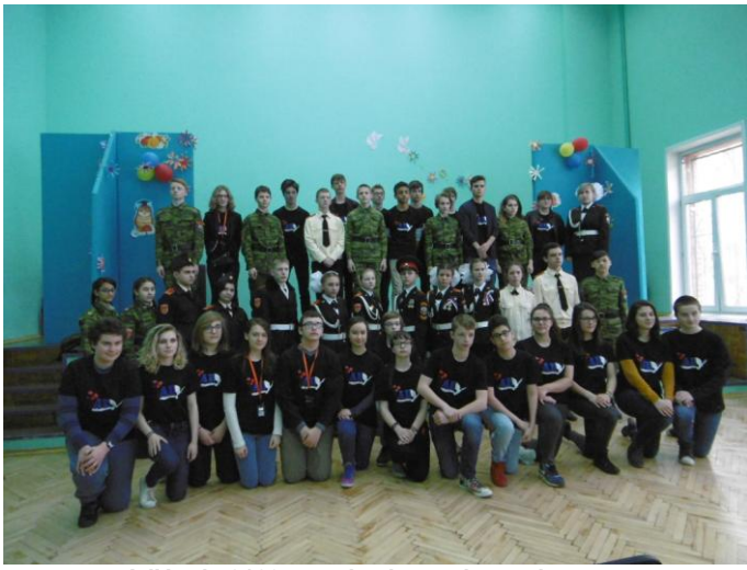
A l'école 2129 avec la classe des cadets.

Ambiance de plus en plus chaleureuse avec échange d'adresses laisse présager la naissance de contacts futurs pour un nouveau projet! Le repas se déroule dans un restaurant ukrainien toujours très typique avec des plats tout aussi savoureux.