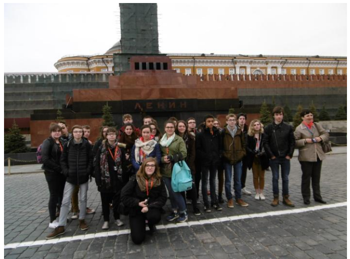
Sur la place rouge devant le mausolée de Lénine.

puis nous nous sommes installés dans un hôtel près du centre-ville et avons apprécié notre première nuit en Russie pour affronter, le lendemain, en pleine forme la première journée de visite.