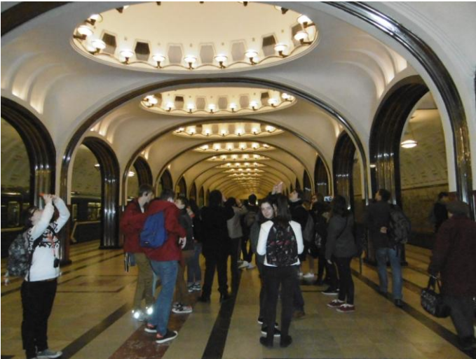
Dans une station du métro.

Encore une journée chargée! Tout commence par la visite des plus belles stations du Métro: rien à voir avec le métro parisien. Tout est propre et soigné! Il faut se dépêcher d'entrer et de sortir des rames car il circule rapidement. Il faut transporter chaque jour 9 millions de passagers.